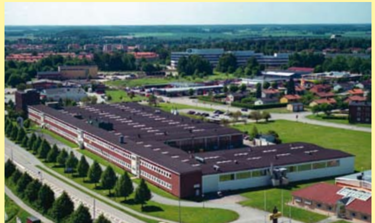
Siège central d'Emsize

Notre concept de conditionnement unique inclut le support à la clientèle et les consultations techniques. Emsize est installé dans de nombreux pays européens et dans le continent Américain.