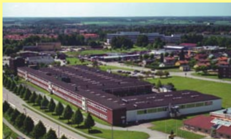
Vi finns i Enköping vid E18:s norra avfart.

Vi ser fram emot att få arbeta tillsammans med er och förbättra er lönsamhet.